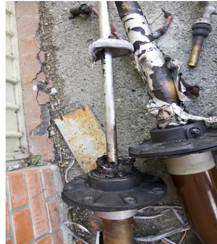
Slika 1: Prikaz havariisanog energetskog transformatora kao posledice eksplozije PI